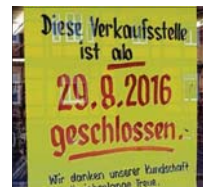
Mit diesem Plakat werden die Kunden informiert.

September auch hier nach einer neuen Möglichkeit gesucht werden. In der Gemeinde Nordharz gibt es ab September nur noch größere Einkaufsmärkte in den Ortsteilen Stapelburg, Wasserleben und Heudeber. In Abtenrode hält sich ein kleinerer Markt, ein ähnliches Projekt in Danstedt scheiterte vor wenigen Monaten an Unwirtschaftlichkeit.