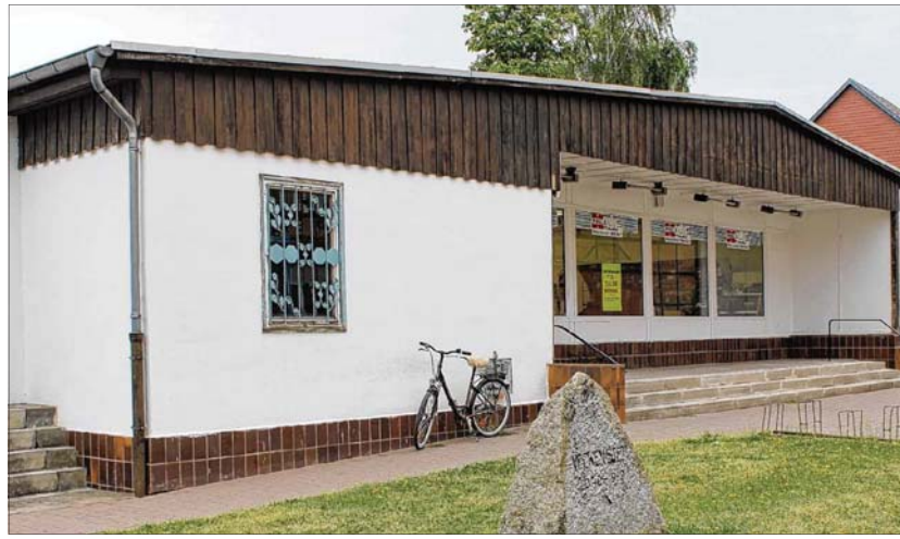
Die Kaufhalle des Ortsteils Veckenstedt schließt am Sonnabend, 27. August. Eine neuer Markt im Ort ist nicht in Sicht.

In Veckenstedt schließt die Kaufhalle. Am Sonnabend, 27. August, ist zum letzten Mal geöffnet. Danach steht die Immobilie zum Verkauf.